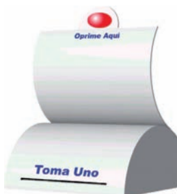
Imagen 7. Toma uno de vcaja