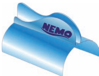
Imagen 6. Toma uno de vitrina