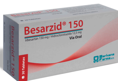
BESARZID 150/12,5 MG

♥ Concentraciones adecuadas para cada tipo de paciente. 7