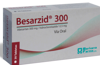
BESARZID 300/12,5 MG